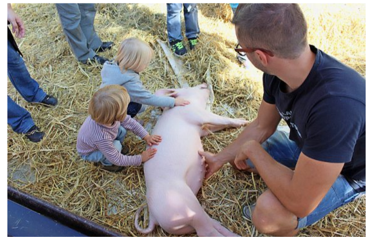
An der Gewerbeausstellung ist der Streichelzoo des Erlebnishofs Hatti bei den Kindern besonders beliebt.

Auch der aktuellen Energiekrise wisse das lokale Gewerbe zu begegnen: «Wir haben keine grossen Stromfresser. Viele Stromverträge konnten bereits vor den Preiserhöhungen unter Dach und Fach gebracht werden. Im Moment bleiben unsere Betriebe darum weitgehend unabhängig.» Am meisten gelitten habe in den vergangenen Jahren das Gastgewerbe, sagt von Känel. «Es herrscht akuter Personal-mangel.» Das Rezept heisse auch hier Zusammenspannen. «So wird sich die lokale Gastronomie